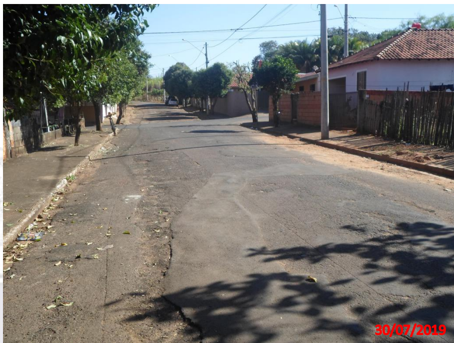
Rua Antonio Leandro