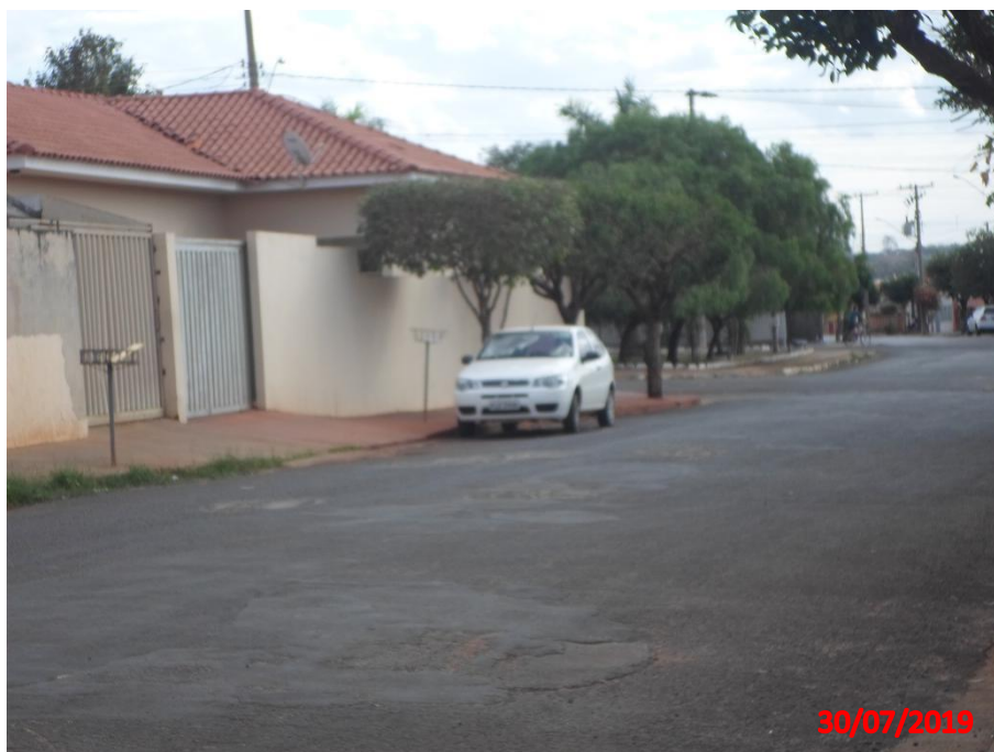
Travessa Santa Maria

2. TRAVESSA SANTA MARIA - Trecho 2 - 537,85 m 2 de recapeamento asfáltico no trecho entre a Rua Ana Maria de Arruda Flait e Rua Vicente Martinez y Martinez, no bairro Jardim Laranjeiras.