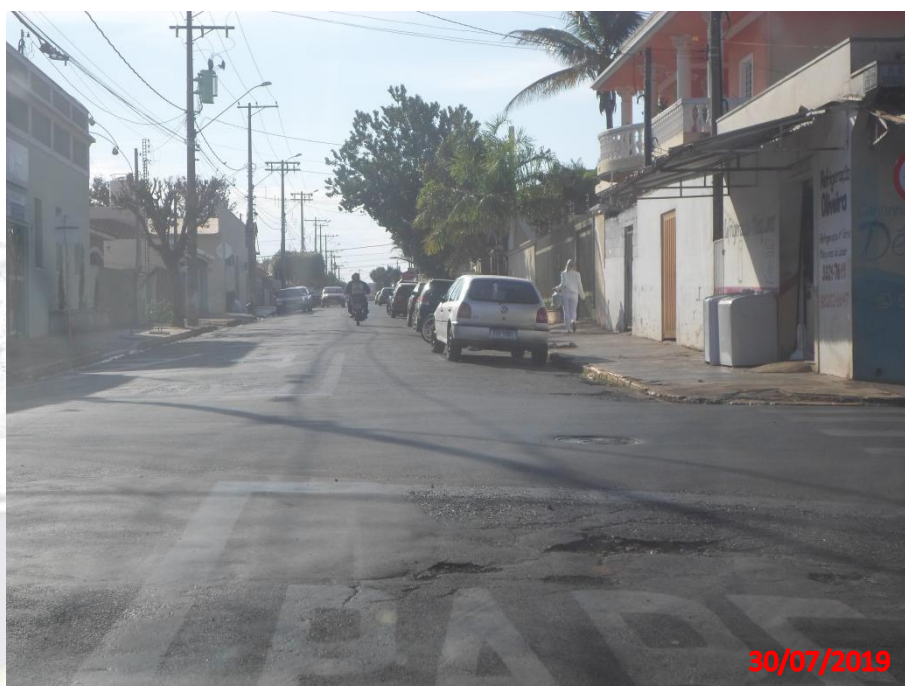
Travessa Santa Maria