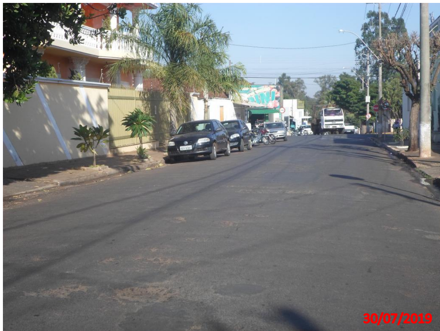
Travessa Santa Maria

Município de Interesse Turístico Capital Nacional dos Bichos de Pelúcia e Acessórios Infantis