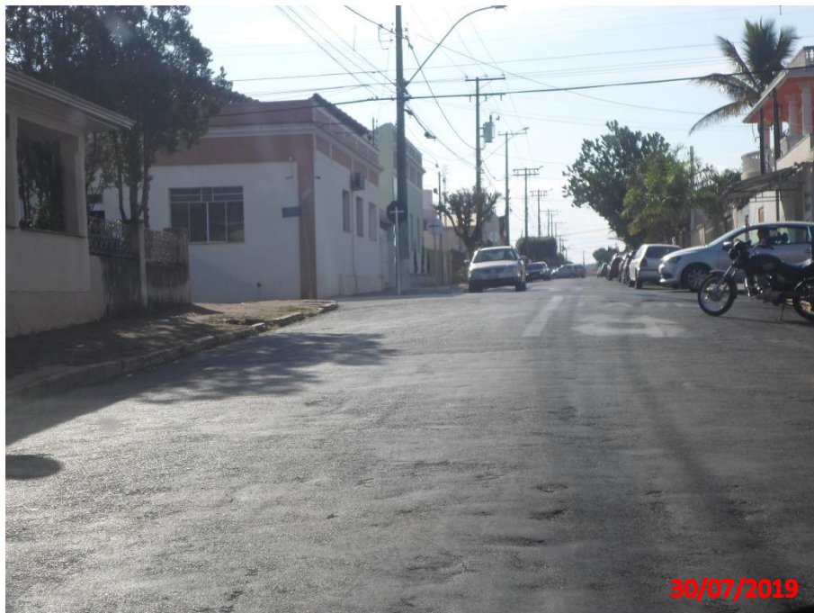
Travessa Santa Maria

Município de Interesse Turístico Capital Nacional dos Bichos de Pelúcia e Acessórios Infantis