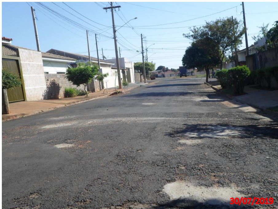
Rua José Grecco

Município de Interesse Turístico Capital Nacional dos Bichos de Pelúcia e Acessórios Infantis