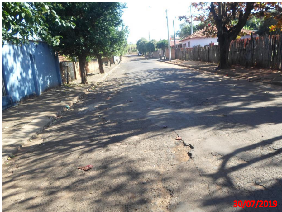
Rua Antonio Leandro

Município de Interesse Turístico Capital Nacional dos Bichos de Pelúcia e Acessórios Infantis