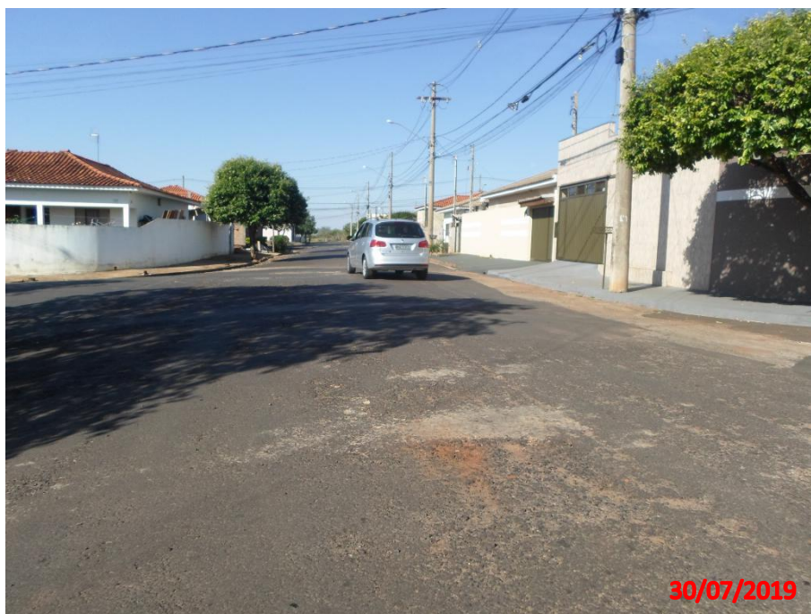
Rua José Grecco

5. RUA JOSÉ GRECCO - 680,09 m 2 de recapeamento asfáltico no trecho entre a Rua Eunice Malaspina Sgarbi e Rua Alexandrino Vicente, no bairro Parque Imperial.