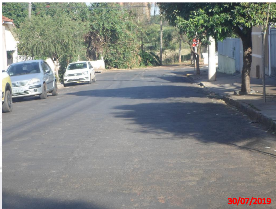
Travessa Santa Maria