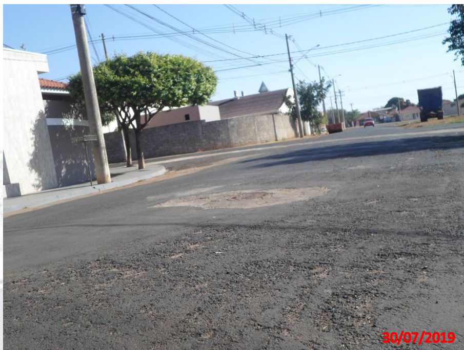
Rua José Grecco