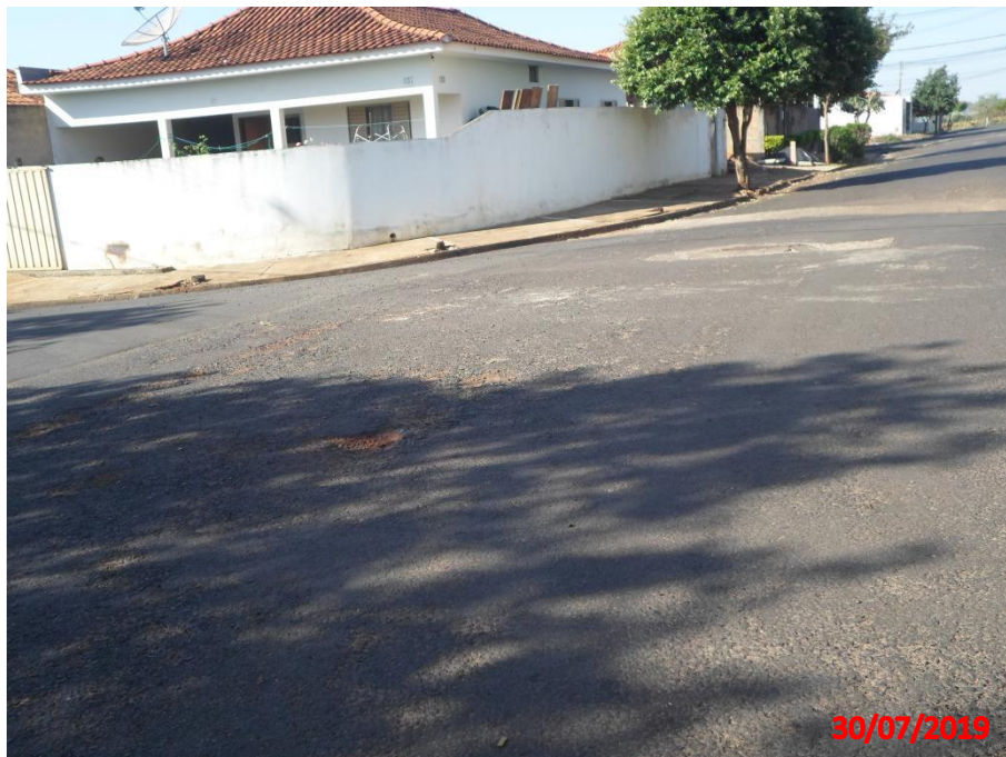
Rua José Grecco

Município de Interesse Turístico Capital Nacional dos Bichos de Pelúcia e Acessórios Infantis