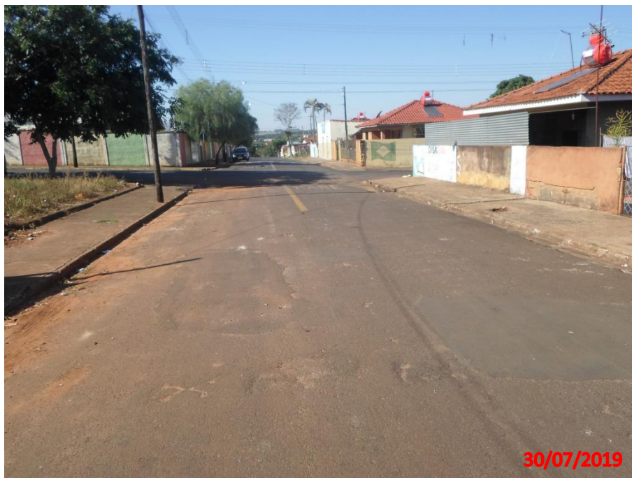
Rua Antonio Leandro

4. RUA ANTONIO LEANDRO - 731,64 m 2 de recapeamento asfáltico no trecho entre a Rua Cel. Firmino de Azevedo e Rua Padre Raul, no bairro Vila Santa Cruz.