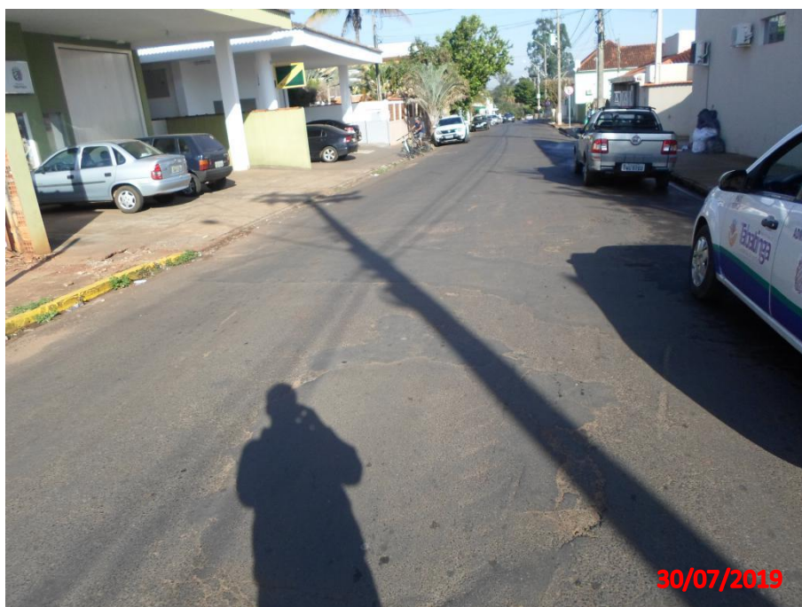
Travessa Santa Maria

1. TRAVESSA SANTA MARIA - Trecho 1 - 1.784,71 m 2 de recapeamento asfáltico no trecho entre a Rua Episcopal e Rua Antonio Caldeira Dantas, Centro.