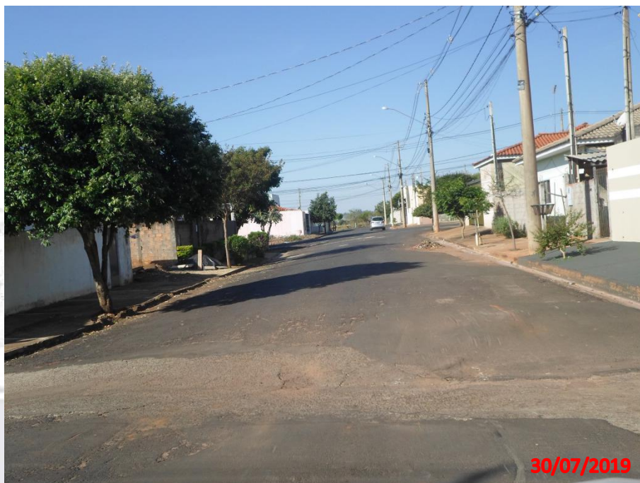
Rua José Grecco