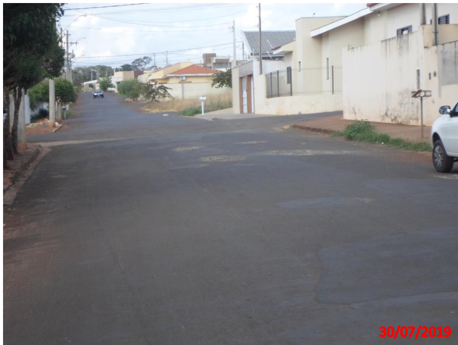
Travessa Santa Maria

Município de Interesse Turístico Capital Nacional dos Bichos de Pelúcia e Acessórios Infantis